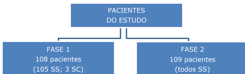
Figura 3 – Resumo do número de pacientes, diagnósticos e fases do estudo. Vinte e quatro pacientes preencheram critérios para inclusão em ambas as fases do estudo.

Foram convidados 110 pacientes, tendo 109 dado sua anuência em participar. Desses, 24 já haviam sido incluídos na primeira fase. No caso de menores de 18 anos o TCLE foi assinado pelos pais ou responsáveis. A Figura 3 resume as especificidades do estudo quanto ao número de participantes, diagnósticos e fases do mesmo.